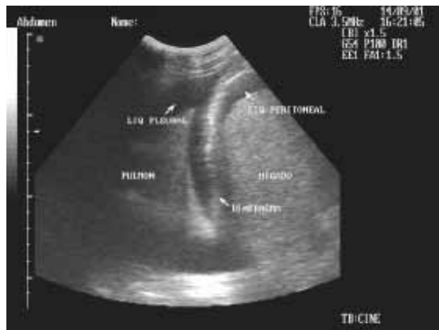
Figura 1. Visión ecográfica del cuadrante superior derecho del abdomen de un paciente politraumatizado, en la que se aprecia líquido libre abdominal (subfrénico) y simultáneamente líquido libre en cavidad pleural.

Cuadrante superior derecho: En esta ubicación uno logra visualizar el hígado, riñón y seno costofrénico derecho y se identifica el espacio hepatorenal (Figuras 1 y 2).