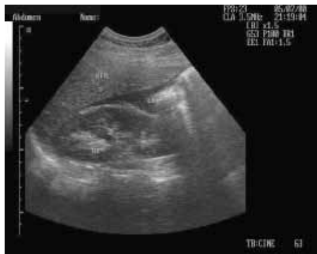
Figura 2. Visión ecográfica del espacio de Morison en un paciente politraumatizado en la que se aprecia líquido libre abdominal.

Epigastrio: en esta ventana se logra evaluar el lóbulo izquierdo del hígado, la parte alta de los grandes vasos y orientando el transductor a cefálico e izquierda se ve el corazón y pericardio (Figura 3).