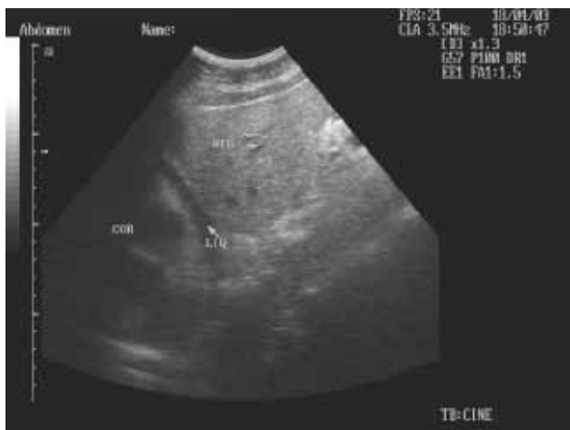
Figura 3. Visión ecográfica del corazón y pericardio de un paciente con un taponamiento cardiaco secundario a una herida penetrante torácica.