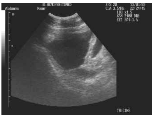
Figura 4. Visión ecográfica de la cavidad pelviana, donde se aprecia la vejiga parcialmente colapsada y abundante líquido libre.

te, la ubicación y movilidad del ecógrafo que se utilice y el número de maniobras que se estén realizando en ese momento y el número de víctimas que están llegando a Urgencia.