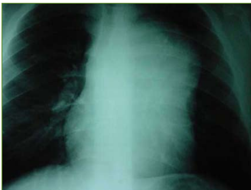
FIGURA 1. Masa Mediastínica.

La historia permite orientar el diagnóstico. La edad da una orientación; los lactantes pequeños tienen mayor frecuencia