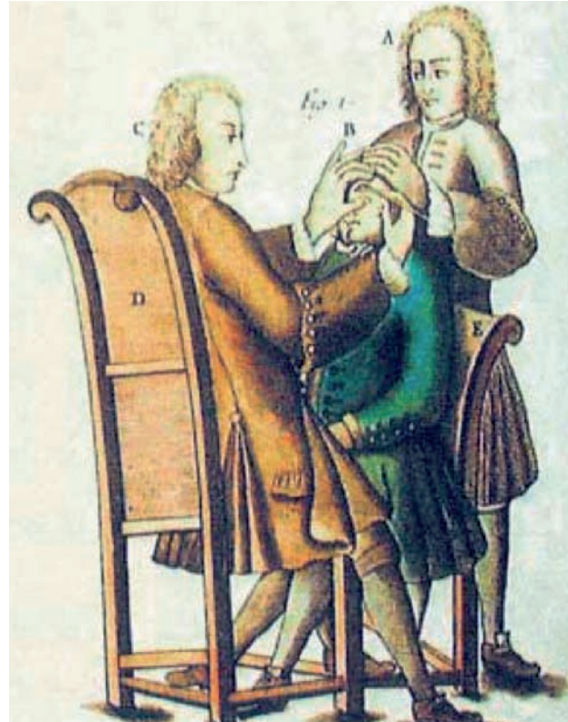
Figura 3/ El procedimiento de curetaje practicado en esa época, sólo con alcohol u opio como anestésicos (5)

La vida de Bach y de Händel fue muy distinta. Bach fue un músico