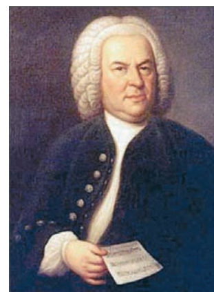
Figura 1/ Retrato de Bach de 1748 uno de los pocos retratos auténticos (1)

Bach fue un hombre vigoroso, sano y robusto. La mayor parte de su vida, tal como se aprecia en uno de los pocos retratos auténticos pintado en 1746, cuatro años antes de morir (Figura 1). Su único problema de salud aparente fue la presencia de dificultades visuales: siempre "fue corto de vista", según informó a JN Forkel, uno de los biógrafos de Bach más fidedignos (2, 3), su hijo Carl Philipp Emmanuel. Sus amigos lo atribuían a su increíble capacidad de trabajo, pasando noches enteras estudiando, leyendo y transcribiendo música (2, 3). Es muy probable que haya sido miope, por su mismo aspecto en el retrato con los ojos entornados y el ceño fruncido (5). Como músico ocupaba horas de trabajo diario en transcripciones y lectura, incluso desde la infancia, fue un excelente alumno y lector, obviando algunos cursos por su rendimiento sobresaliente (5) (la necesidad de un trabajo de cerca hace improbable un defecto de refracción que no sea miopía (6)).