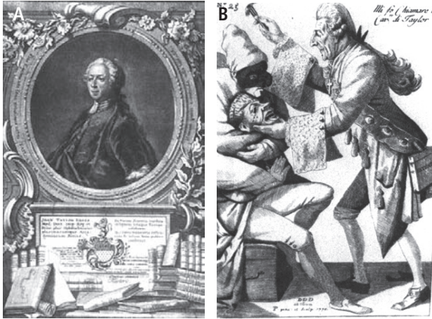
Figura 2/ A) El oftalmólogo John Taylor quien opera a Bach en dos ocasiones y en B) en un grabado italiano de la época en que se le caricaturiza como charlatán (7,8).

desplegado a tal perfección” y “un ejemplo de cuán lejos la imprudencia e ignorancia pueden llevar” (8). Al trasladarse en sus viajes utilizaba un carruaje completamente pintado con ojos y con una leyenda que decía “quién da visión, da vida”, en sus viajes llega hasta Rusia y Persia (5). Habría muerto en París en 1772, según la leyenda, ciego (7,8).