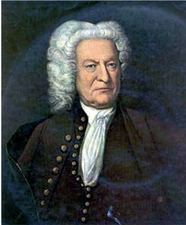
Figura 5/ Retrato posible de Bach a los pocos meses antes de morir en 1750, en que se observa un claro empeoramiento en aspecto general con respecto al retrato de 1748 (1).

la capilla de la iglesia de Leipzig. El deterioro de la escritura de Bach en los últimos meses y sus mejorías transitorias, harían plantear crisis isquémicas cerebrales, teniendo como factor de base una diabetes mellitus que explicaría las cataratas y un episodio final también vascular (11). Un último retrato del período de enfermedad de Bach se presenta en la Figura 5. No deja de ser irónico el hecho que el único contacto directo de Bach y Häendel, a pesar de los esfuerzos principalmente por parte de Bach de encontrarse, haya sido a través del hombre que los operó sin éxito, quedando ciegos ambos, Bach en Alemania y Häendel en Inglaterra.