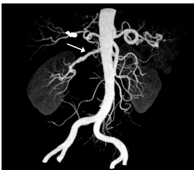
Figura 2: Displasia fibromuscular de arteria renal derecha. Se observa la típica imagen en rosario. Imagen obtenida por Angio-TAC.

como la cateterización de la arteria umbilical en el recién nacido. La estenosis de las arterias renales es bilateral en 53 a 78% de los niños con enfermedad renovascular y también, se describe una cierta predisposición familiar en 11 a 60% de los casos (7):