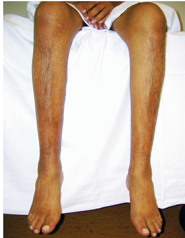
Figura 3: Fibrosis sistémica nefrogénica. Piel de pergamino, rigidez de extremidades inferiores y atrofia muscular por inmovilidad.

Si bien los beneficios de la restauración del flujo sanguíneo renal parecerían obvios, las complicaciones del procedimiento en pacientes ateroscleróticos, como enfermedad ateroembólica, reestenosis, disección vascular y trombosis, obligan a cierta cautela, y a no prescribir el tratamiento endovascular en pacientes con buen control farmacológico de la hipertensión arterial y función renal estable. La angioplastia es una