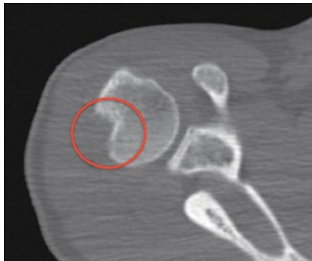
Figura 4. Cortes axiales de TAC óseo. Evidencia de una fractura por impactación (hundimiento) de la cabeza humeral en la región posterosuperior. Lesión de Hill-Sachs.

del tamaño, de la orientación y de la posición de la lesión de Hill-Sachs ésta puede ser enganchante o no enganchante (12) (Figura 4).