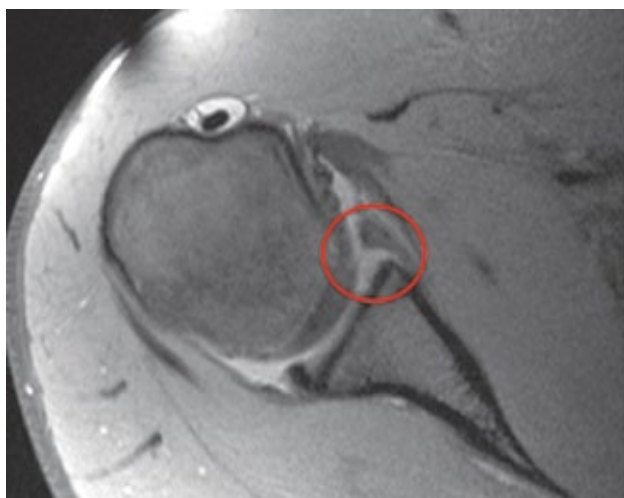
Figura 3. Cortes axiales de resonancia magnética donde se observa un desprendimiento del labrum glenoideo en su porción anterior (círculo).

Otra de las lesiones frecuentemente que se encuentra asociado a la inestabilidad es la lesión de Hill-Sachs. Es una fractura por hundimiento, es decir, por impactación, que se produce en la región posterosuperior de la cabeza humeral cuando esta vuelve bruscamente sobre el reborde glenoideo anterior luego de una luxación (Figura 3). Esta lesión, un poco menos frecuente que la lesión de bankart, también puede condicionar la aparición de nuevos episodios de inestabilidad.