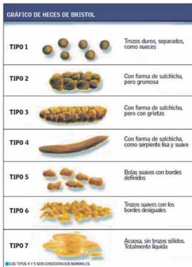
Figura 1. Escala de Bristol.

El examen físico debe incluir la palpación del abdomen en la búsqueda de deposiciones palpables que impliquen una retención estercorácea.