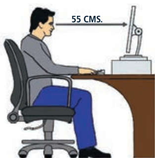
FIGURA 3. RECOMENDACIONES PARA USUARIOS DE COMPUTADOR