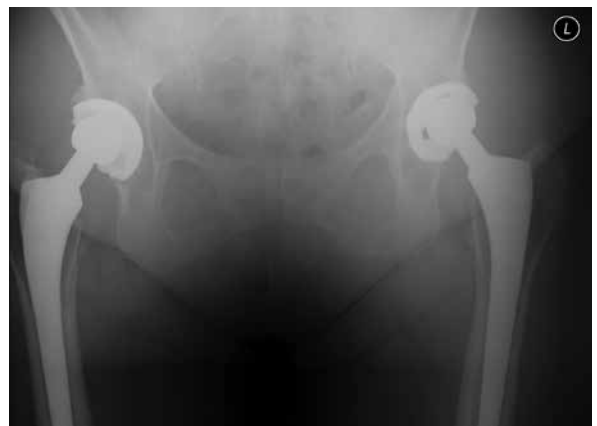
Figura 1. Radiografía de pelvis en un seguimiento a 20 años de una mujer de 65 años con reemplazo total de cadera bilateral por osteoartritis y displasia acetabular moderado. Su estado funcional bilateral es excelente aunque las radiografías indican un desgaste moderado de los forros de polietileno convencionales.