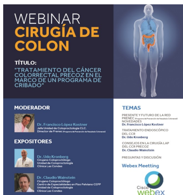
Afiche Promocional del Curso de Capacitación.

Con fecha 23 de julio del presente año, los integrantes del staff médico que conforman la Unidad de Coloproctología de CLC efectuaron un Webinar sobre el "Tratamiento del cáncer colorrectal precoz en el marco de un programa de cribado".