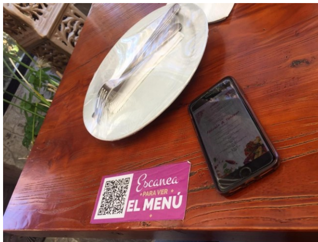
Desde el punto de vista del control y prevención de contagios, distintos restaurantes están incorporando nuevos menús digitales que utilizan códigos QR, en reemplazo de sus ya tradicionales menús de papel.