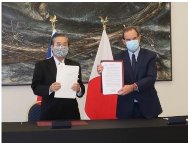
Fotografía durante la Ceremonia Oficial de Firma.

Con toda la atención del mundo puesta en el arribo de la segunda y tercera ola de la pandemia, la situación actual continúa siendo sumamente compleja. No obstante, esperamos con ansias la pronta llegada del día en que podamos volver a disfrutar de nuestra vida cotidiana con total normalidad.